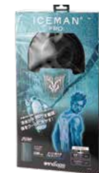
パッケージイメージ