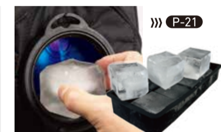
アイスマンキューブ(別売)に対応