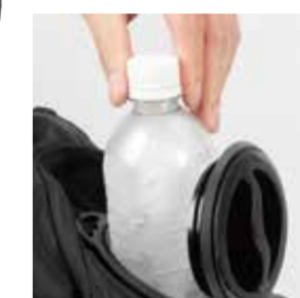
650mlペットボトル対応