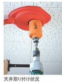
天井取り付け状況