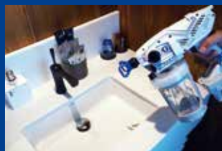
接触の多い場所への除菌・消臭