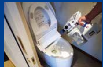
トイレ清掃時の除菌・消臭