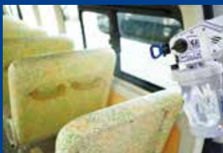
車内の除菌・消臭

品名:ジーミスト200 主成分:次亜塩素酸(原料:次亜塩素酸イオン水溶液)、純水 濃度:約200ppm 性質:弱酸性(PH4.5~6.5) 使用期限:4L、10L、20L 製造月より2年、詰替後はお早めにお使いください (遮光性のある容器に詰め替えてお使いください)