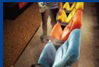
公共・商業施設の除菌・消臭