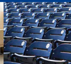
競技場と競技施設