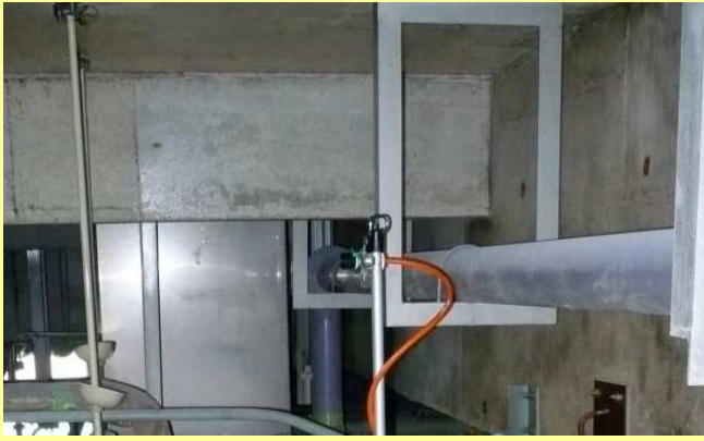
アスキヤッチ CC 塗布 (透明仕上げ)