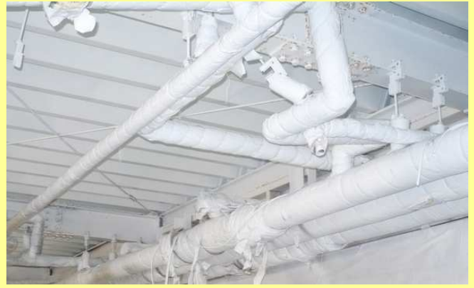
アスキヤッチ CW 塗布 (白色仕上げ)