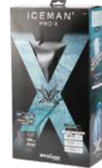
パッケージイメージ